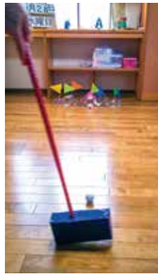
カゴカゴゴルフゲーム

こちらのゲームは、室内でできるゴルフです。大きなの違うペットボトルを何本か用意して、底を切り落とします。そのペットボトルにお手製の旗を立て、点数を書きます。大きなボトルより小さなボトルの方に点数を高く設定します。10本くらい並べてそこにゴルフボールを転がして点数を競います。簡単でしょ! でもね、これが結構難しい。床の板がヨコに並んでいるので、思った方向に行かないのです。それが面白い。見ているだけなら、なくんだと思いますが、やってみると結構難しい。やっていると何とかが高い点数を取りたいと思うのがツボです。人間