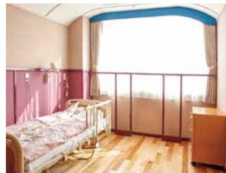
各部屋の造りは違います

「別荘」に殊をつれてご家族が遊びにこられました。お友達が来られる事もあられるのです。家族の訪問には、まあ正直言つてスタッフのどんなサービスもかかないません。写真の真ん中に写っている利用者さんの顔をじっくりと見たい。なんとも言えないホンワカとした感じが伝わってくるではありませんか。」