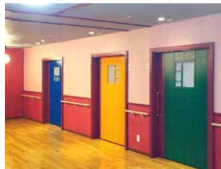
部屋は全部で5つあります